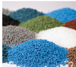
Industrie des plastiques